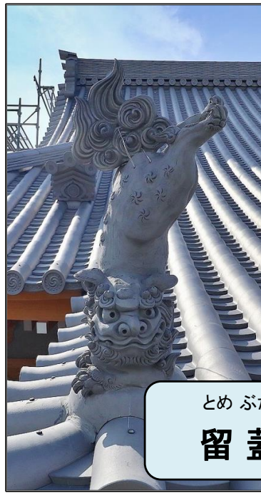
とめふた がわら 留蓋瓦