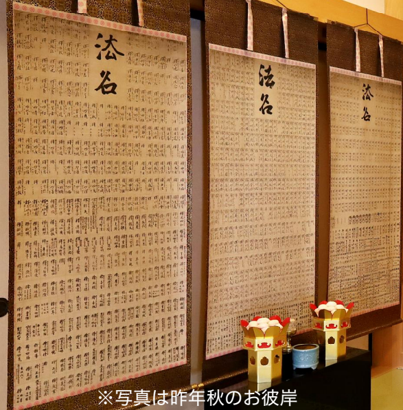
※写真は昨年秋のお彼岸